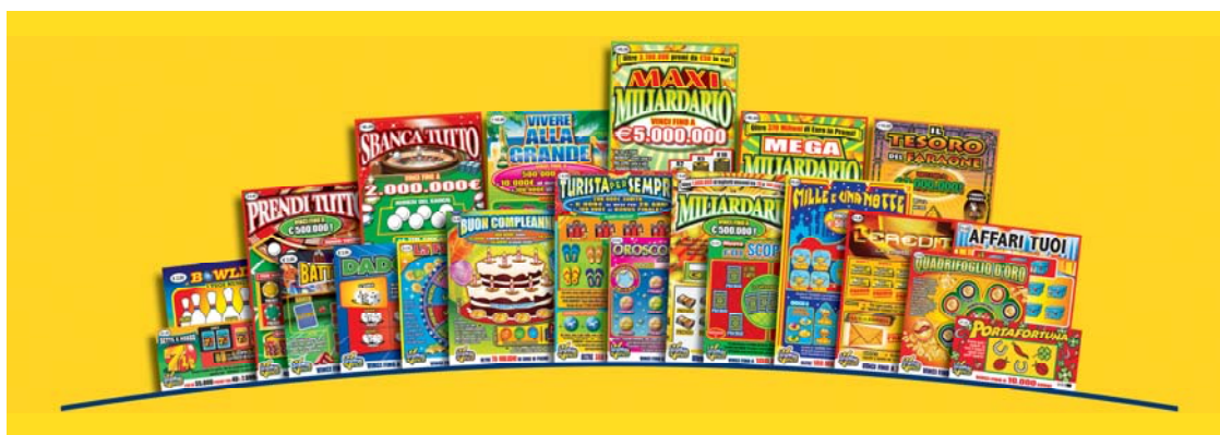
Sopra: alcuni biglietti di lotterie istantanee Gratta e Vinci attualmente in vendita

I biglietti Gratta e Vinci si trovano in vendita presso bar, tabaccai, edicole, autogrill e tutti i rivenditori autorizzati che espongono il marchio distintivo. Tali punti vendita sono dotati di uno speciale terminale che consente la validazione, cioè il controllo on-line dei biglietti vincenti, e quindi un immediato e sicuro pagamento dei premi.